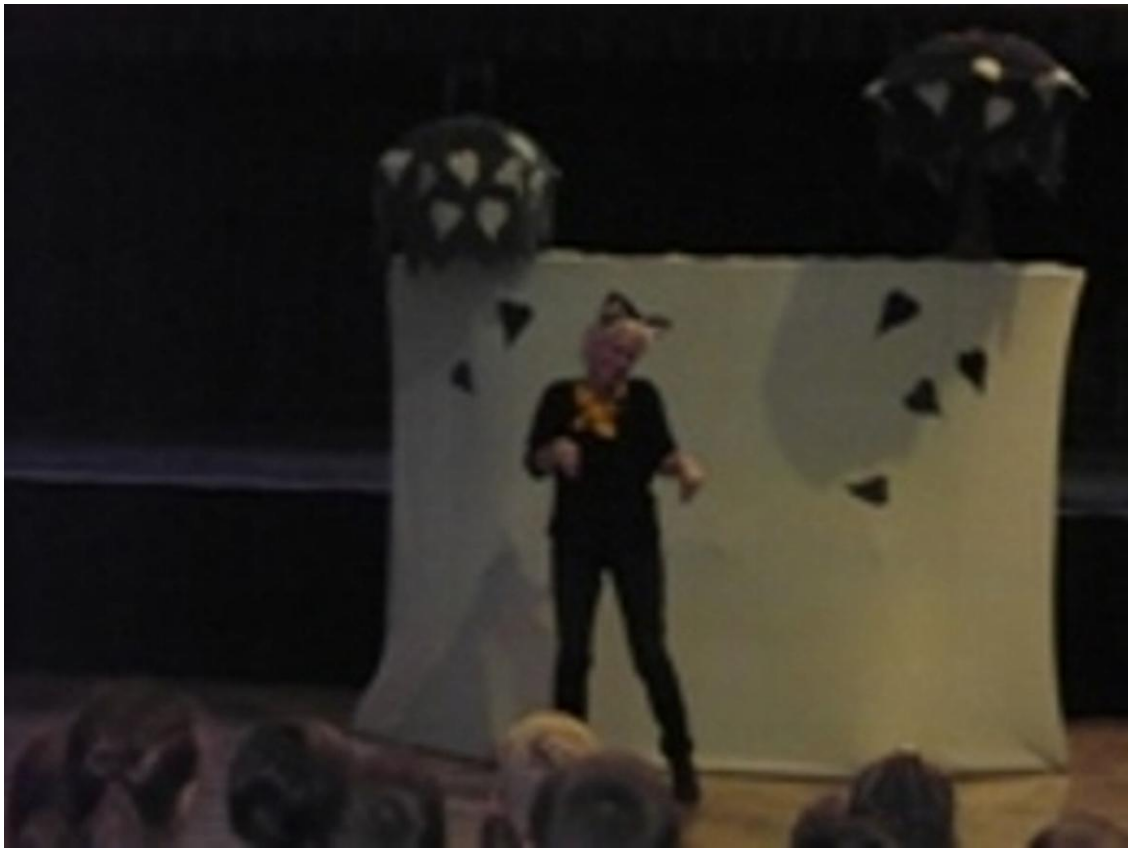
Portéka Színpad – Pilisszentiván, 2016. október 3.