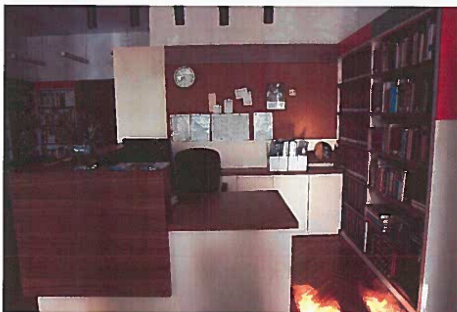
és ilyen lett az új.