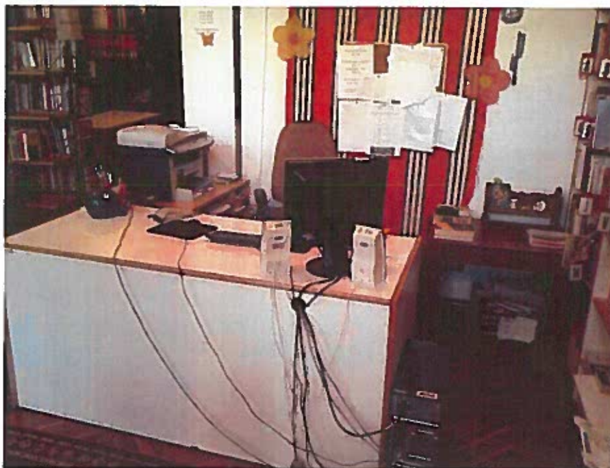
Ilyen volt a régi kölcsönzőpult...