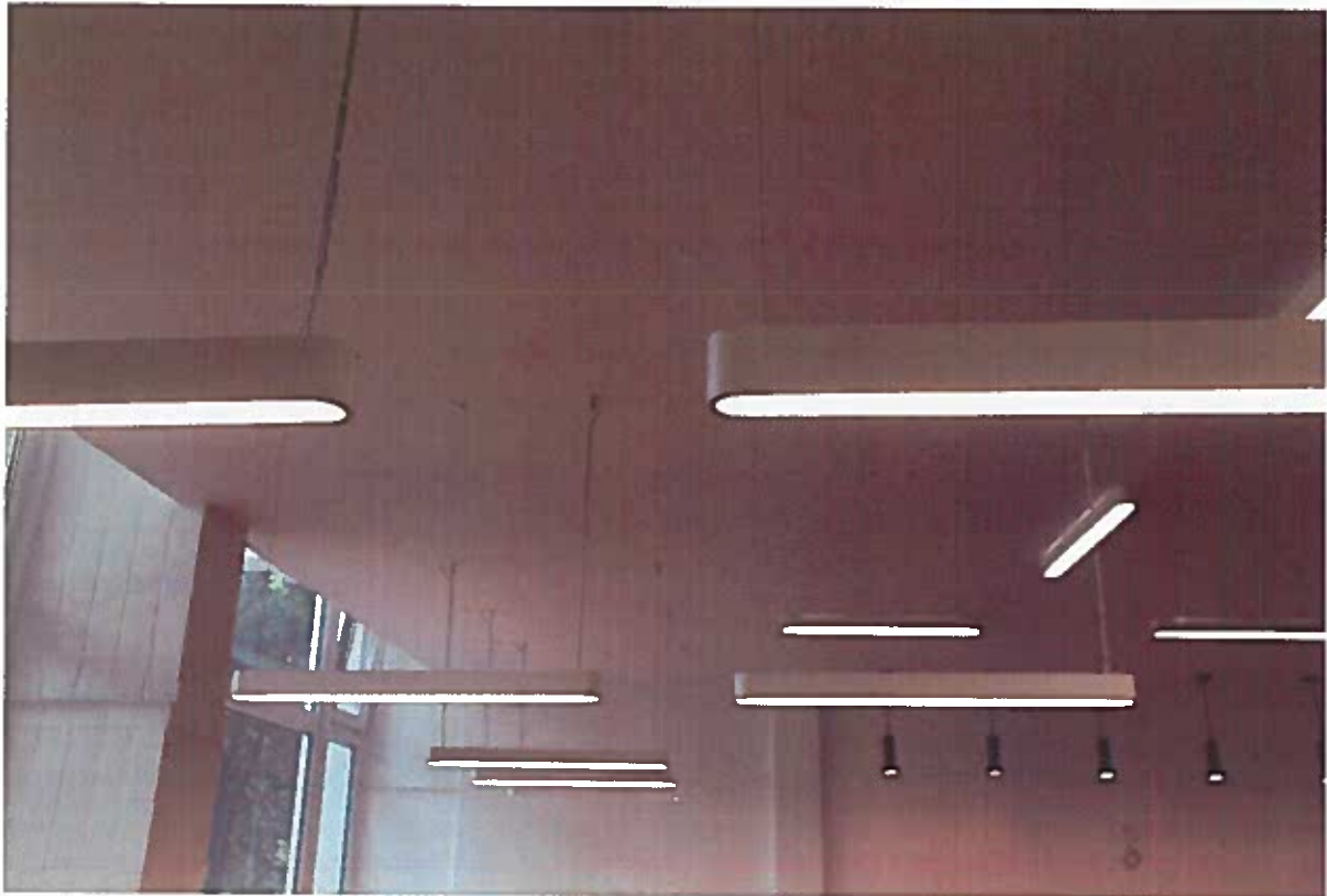
a felújított világítás