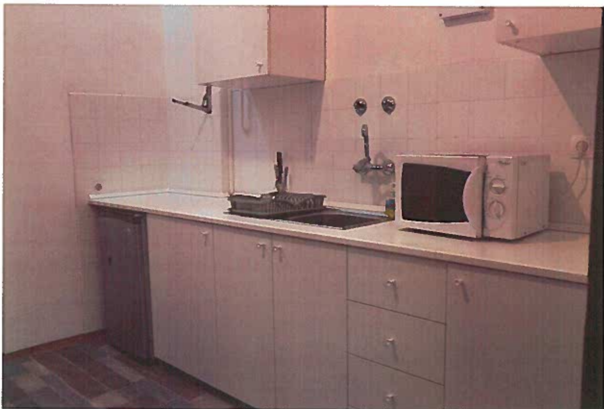
a kialakított új konyha