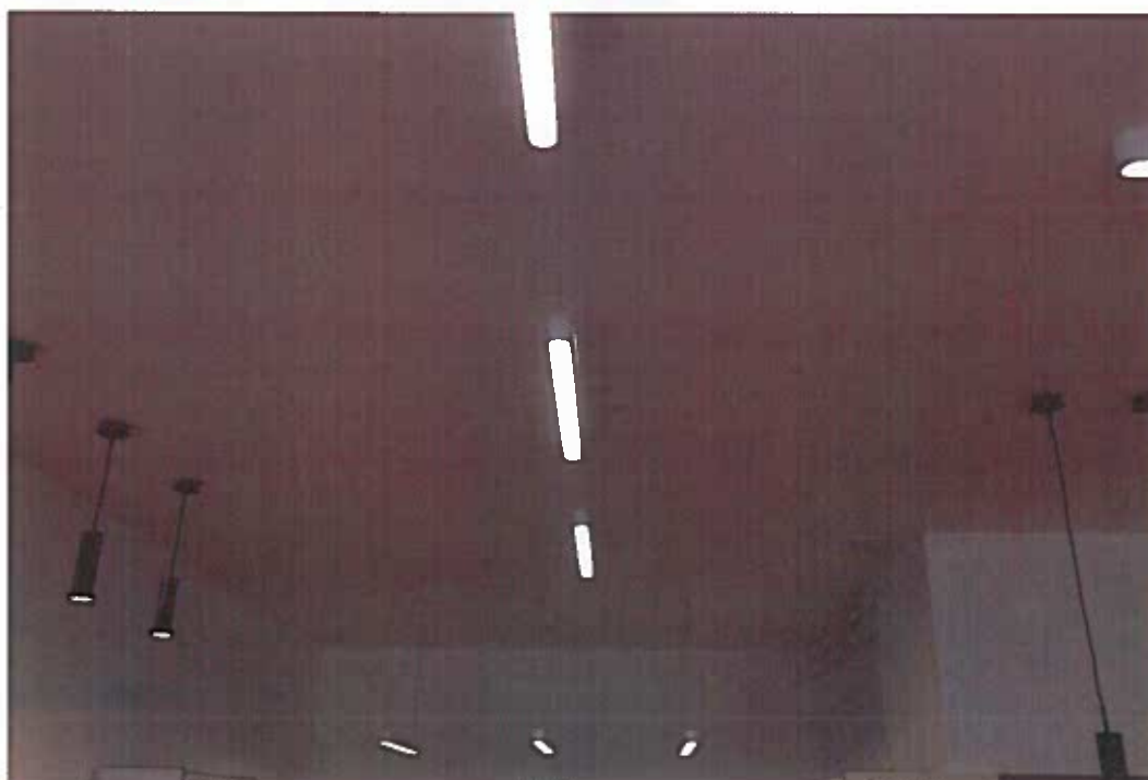
A felújított álmennyezet. Előtte - utána állapot.